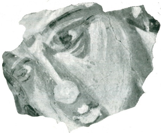
3. Фрагмент фресковой росписи храма XV в. из Довмونتова города.

и планировке одной из древнейших частей Пскова — территории Довмونتова города, в связи с превращением ее в административный центр средневекового Пскова. Деревянные постройки горожан здесь сменяются каменными зданиями административного назначения и культовыми постройками, представляющими собой бесценные памятники архитектуры, памятники формирующейся псковской школы зодчества.