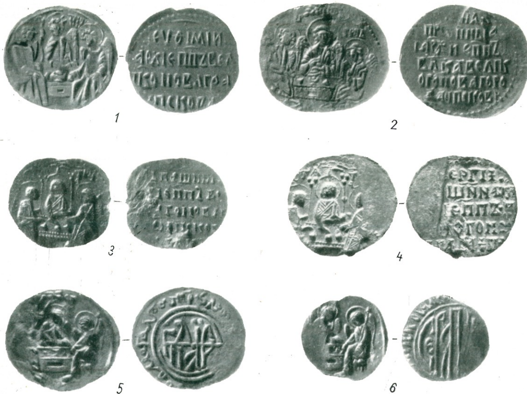
5. Печати наместников новгородских архиепископов XV—XVI вв.: 1. Евфимия (1429—1458); 2. Иоанна (1459—1471); 3. Феофила (1471—1480); 4. Сергия (1483); 5. Геннадия (1485—1505); 6. Серапиона (1506—1509).

Само географическое расположение города на северо-западных рубежах древнерусского государства определило роль древнего Пскова как города-воина, о мощные крепостные стены, о волю и военное мастерство жителей которого не раз разбивались вражеские полчища.