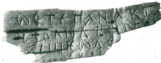
4. Берестяная грамота XII в. из раскопок Довмونتова города.

Являясь единственной такого рода находкой в практике археологических исследований древнерусских городов, архив представляет собой важный источник для изучения не только организации административного управления средневекового города, но и позволяет в значительной мере расширить наши сведения о политической истории древнего Пскова.